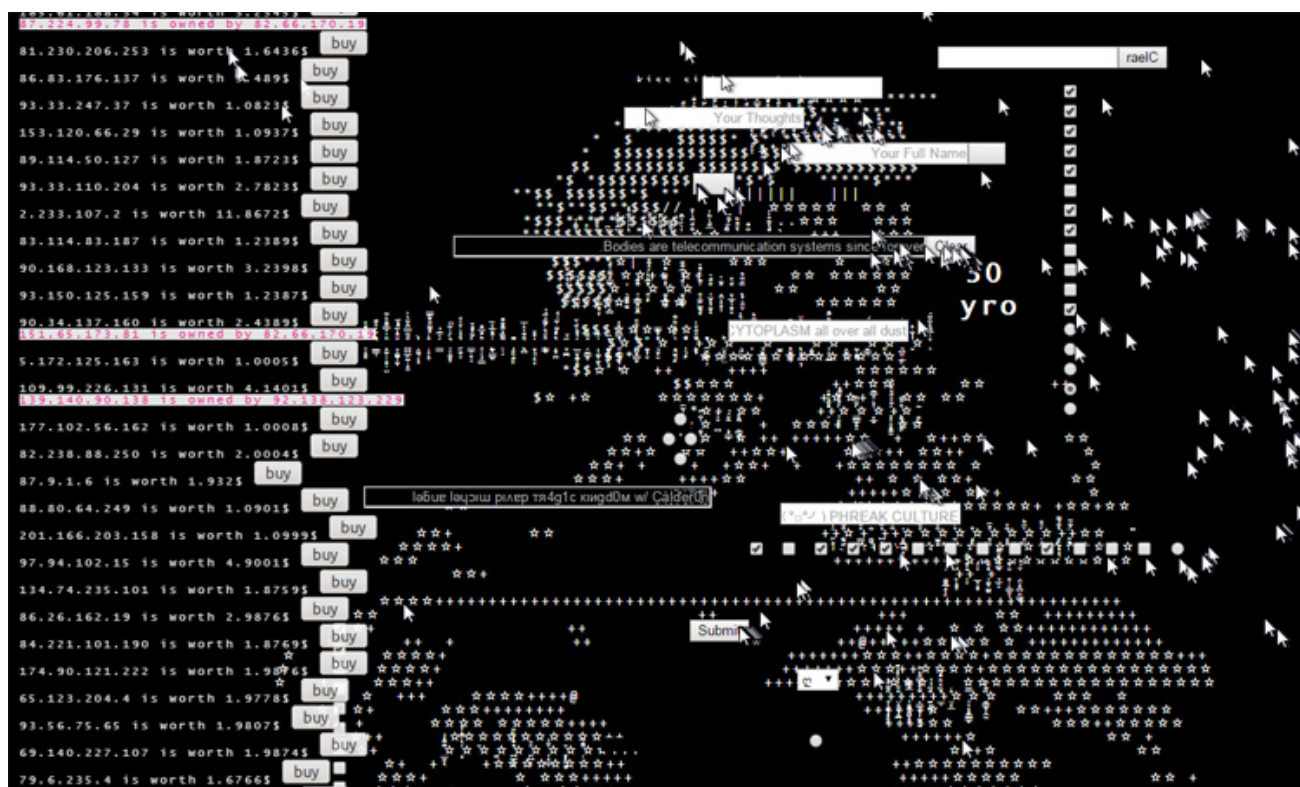
David (Hugs n Kisses XOXO) , Emilie Gervais, screenshot, Link Cabinet dal 13 luglio al 23 agosto 2015

Link Cabinet è un progetto curato da Matteo Cremonesi per Link Art Center in cui artisti internazionali vengono inviati a esporre un'opera online site-specific ovvero a sviluppare un'applicazione nello spazio di una singola pagina web che sfrutti le potenzialità e i linguaggi propri della rete. Alla fine del periodo espositivo le opere, visibili solo online dal sito del progetto, non sono più disponibili in rete.